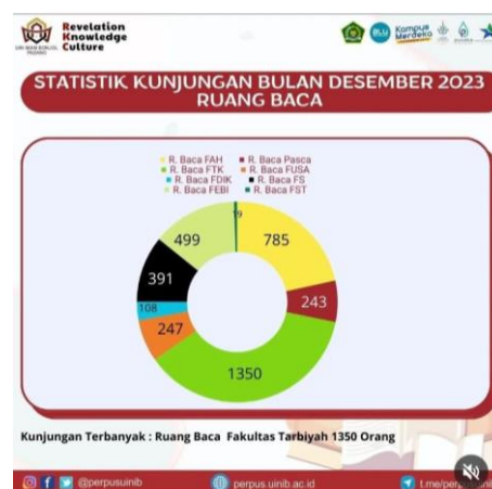
Gambar 2. Statistik Kunjungan Ruang Baca Fakultas Tarbiyah dan Keguruan Bulan Desember 2023

Narasumber: Rencana nya ada untuk memperluas, tetapi itu bukan wewenang dari pustakawan. Pustakawan hanya mengusulkan agar ruang baca fakultas ini lebih besar dari ini, karena di fakultas ini mempunyai 10 prodi, jadi ruang baca ini yang paling banyak mahasiswanya. Ketika libur ini ada sekitar 50-60 orang pengunjung dalam sehari, jika hari biasa ada sekitar 500 mahasiswa yang berkunjung setiap hari nya. Koleksi disini tidak bergantung pada Pendidikan saja, ada koleksi mengenai al-qur'an, tafsir, hadis, hukum islam. Kemudian untuk ruangan baca ini kadang tidak mencukupi untuk mahasiswa yang datang dalam sehari karena ruang baca ini masih terdapat sekat-sekat yang menghambat untuk meningkatkan koleksi buku pada ruang baca fakultas.