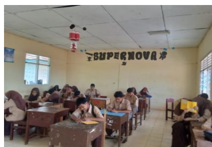
Gambar 1.1 Kegiatan Literasi 15 Menit

Meskipun Gerakan Literasi 15 Menit telah diterapkan di banyak sekolah, pelaksanaannya di lapangan menunjukkan hasil yang beragam. Beberapa penelitian menyebutkan bahwa kegiatan literasi 15 menit mampu meningkatkan minat baca dan pemahaman siswa, namun di sisi lain masih ditemukan berbagai kendala seperti keterbatasan waktu, rendahnya minat baca siswa, serta kurang optimalnya pengawasan guru (Ashari et al., 2024).