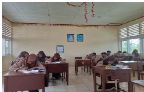
Gambar 3.1 Kegiatan Literasi 15 Menit

Sarana pendukung pelaksanaan literasi di SMP Negeri 2 Salimpaung meliputi perpustakaan sekolah, pojok baca di kelas, serta koleksi buku bacaan yang tersedia di masing-masing kelas. Meskipun fasilitas yang tersedia masih terbatas, sekolah berupaya mengoptimalkan sarana yang ada agar kegiatan literasi tetap dapat berjalan secara konsisten.